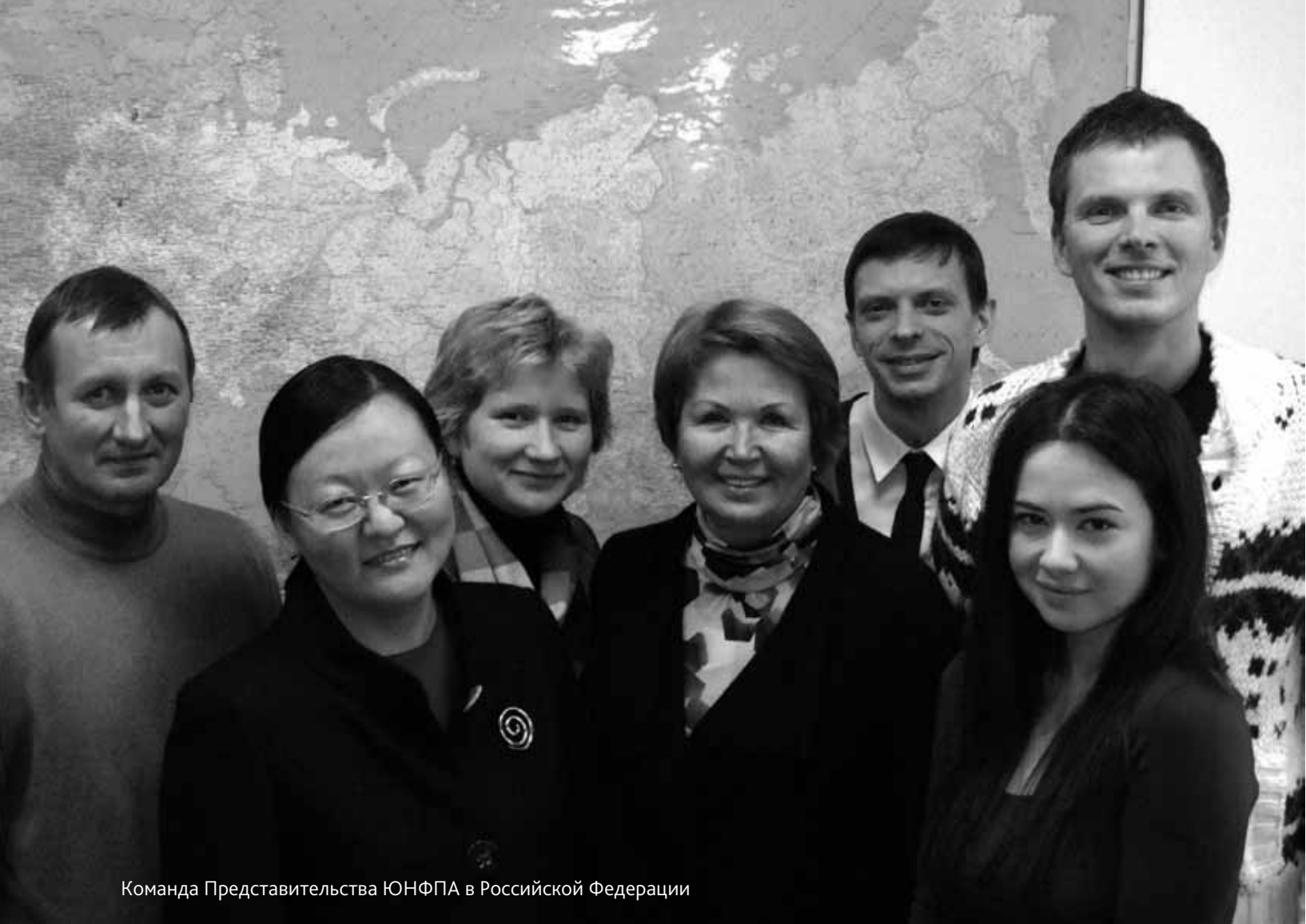
Команда Представительства ЮНФПА в Российской Федерации